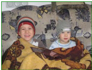
Egyfolytában csak szellőztettünk.