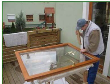
Ablaküveg csere (2009)