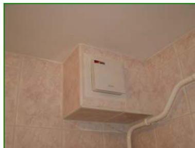
Az új szellőztető berendezés