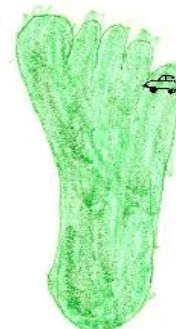
Veronika (5) lábnyoma

Ez összesen 23 kg kibocsátás, ami már 2% körüli arányt jelent. Ez még mindig elmarad a valóban autós családok közlekedési kibocsátásától. Látható azonban számunkra az adatokból, hogy a havi egyszeri vásárlás a hipermarketben aránytalanul sokkal növeli a kibocsátást. A nyaralásunk lábnyomára közelítőleg 80 kg-ot számoltunk, amely pedig 3,5-szerese a havi teljes (közlekedéshez köthető) kibocsátásunknak.