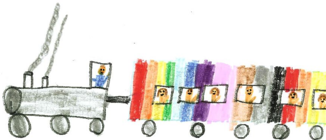
Domonkos (7): vonatozik a családkunk